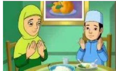
Ketika hendak makan atau minum