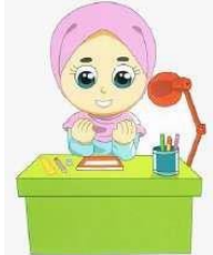
Ketika akan belajar