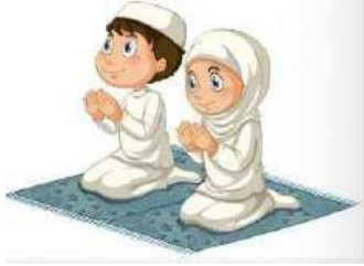
Ketika akan shalat dan berdoa