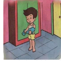
Ketika hendak berpakaian