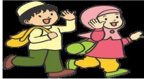
Ketika hendak bepergian atau berangkat sekolah