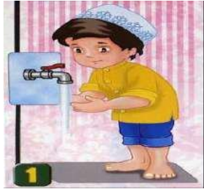
Ketika hendak berwudhu